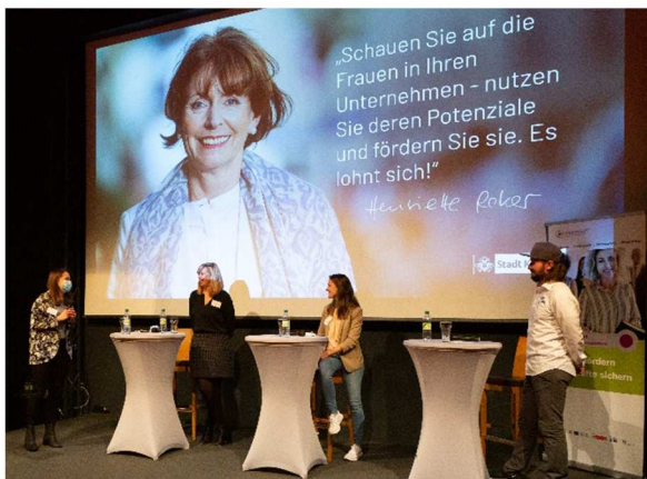
Bildbotschaft von Oberbürgermeisterin Henriette Reker

Nach dieser aufschlussreichen und lebendigen Gesprächsrunde, kam es zu einigen Nachfragen aus dem Publikum zu den Themen Kinderbetreuung, Beratungsmöglichkeiten und Rekrutierung. Eine digitale Bildbotschaft von Kölns Oberbürgermeisterin Henriette Reker verstärkte noch einmal die Aufforderung an die Unternehmen, Frauen und ihre Potenziale stärker in den Blick zu nehmen.