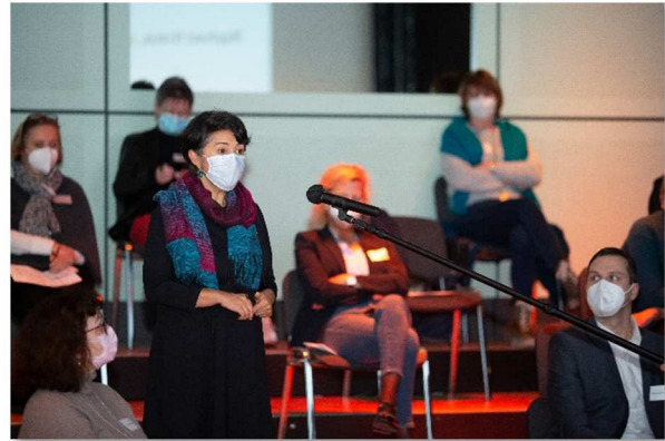
Fragen aus dem interessierten Publikum