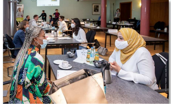
Im Oktober 2020 im Kölner Rathaus: Die Tandems im Gespräch.

Der Tandembuilding-Tag des Programms Mentegra fand am 8.10.2020 im Kölner Rathaus statt. Dort erhielten die sieben Tandems erstmalig die Gelegenheit, sich persönlich kennenzulernen. Das war aufgrund der Pandemiesituation besonders erfreulich und wichtig. Fünf Mentorinnen, zwei Mentoren und vier Mentees schilderten jeweils in einer kurzen Darstellung ihre berufliche Situation und ihre Motivation, an Mentegra teilzunehmen.