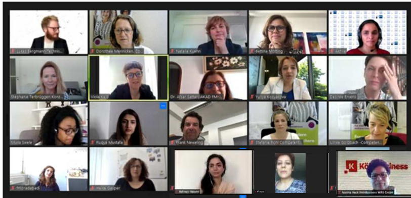
Freudenfest vor dem Bildschirm: Die Abschlussveranstaltung von Mentegra

Am 1. Juni 2021 zogen 23 Teilnehmende, leider wiederum nur digital vor dem Bildschirm, Bilanz auf der Abschlussveranstaltung des Projekts Mentegra.